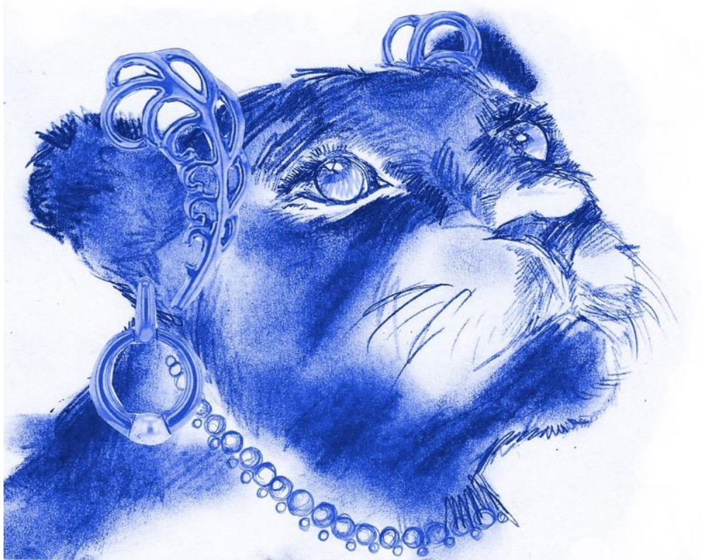
Tekeningen: Aline Breucker

Je kan en mag doen wat je nodig hebt om je goed te voelen.